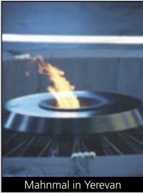
Mahnmal in Yerevan